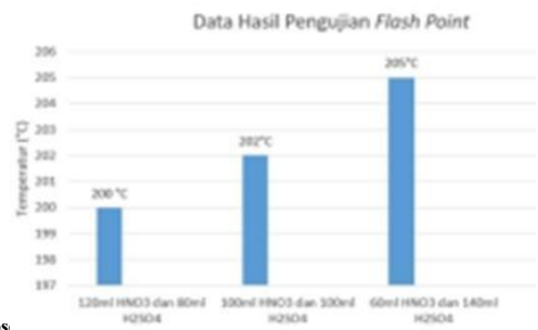
Grafik 2. Pros